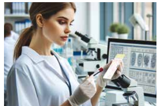
L'examen de l'échantillon de sang dans un laboratoire médical