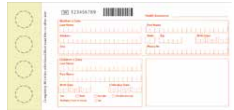
Carte de test du est de piqûre au talon

La SOLID 85E/F90HD imprime les cartes de dépistage néonatal rapidement et efficacement.