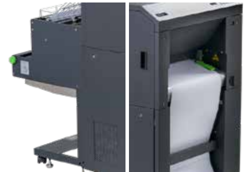
Le SOLID 85E/F90HD avec alimentation par tractor et empileur haute capacité