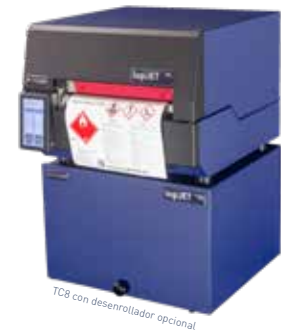
TC8 con desenrollador opcional

MICROPLEX PRINTWARE CORPORATION 30300 Solon Industrial Pkwy Suite E, Solon, OH 44139 USA Phone: +1 440-374-2424 E-Mail: info@microplex-usa.com