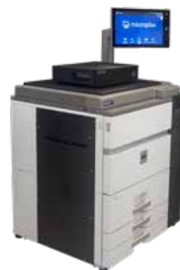
Abbildung 2: SOLID 105A3-2

Da die Druckaufträge nicht immer unmittelbar einem Paket zugeordnet werden sollen, wurde in einem vorherigen Projekt eine Auffangeinheit entwickelt, die diese Druckaufträge zwischenlagert und nach Freigabe ausgibt.