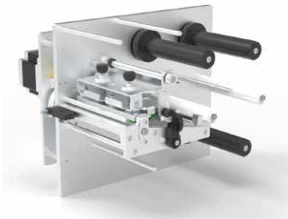
Abbildung 1: Modell 4 Zoll Druckwerk

Die Abbildung 1 zeigt ein bereits konstruiertes 4-Zoll-Druckwerk als 3D-Modell.