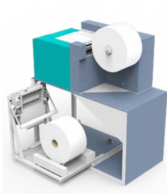
Abbildung 4: 3D-Modell Papierzuführung

In Abbildung 4 sehen Sie die Konstruktion einer Papierzuführung für einen Vollfarb-Endlosdrucker.