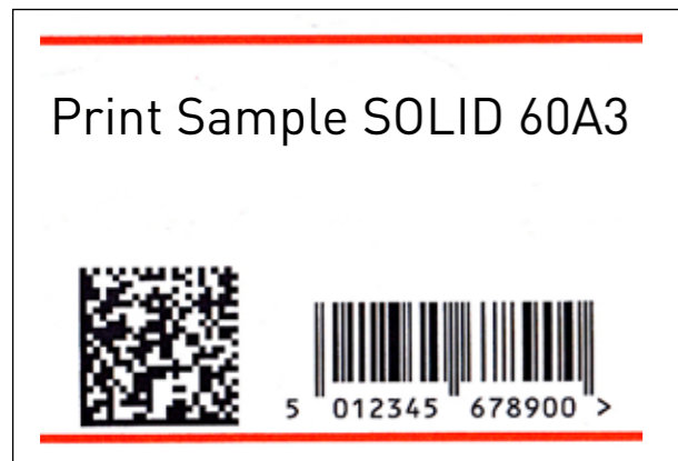
Druckqualität SOLID 60A3