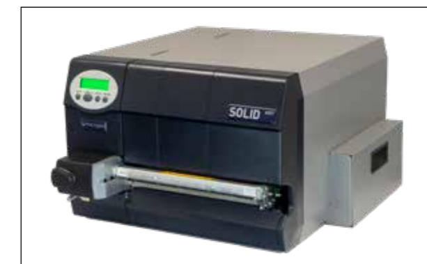
SOLID 45ET-1 / SOLID 45ET-2