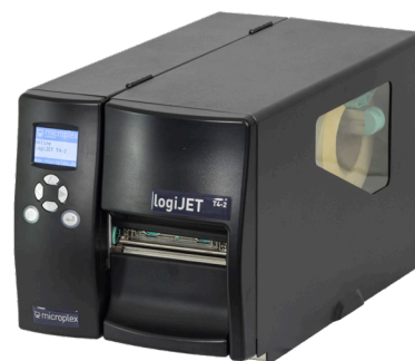
logiJET T4-2 Etikettendrucker

EMEA APAC MICROPLEX PRINTWARE AG Panzerstraße 5, 26316 Varel Phone: +49 4451 91370 E-Mail: sales@microplex.de www.microplex.de