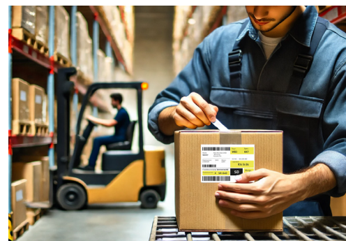
Rücksendepaket mit Lageretikett