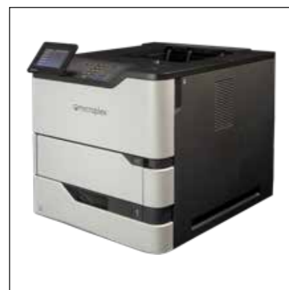
Imprimantes laser feuille-a-feuille - p.e. SOLID 52A4