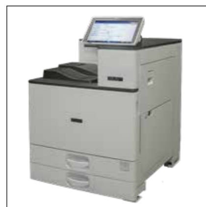
Imprimantes laser feuille-a-feuille - p.e. SOLID 60A3