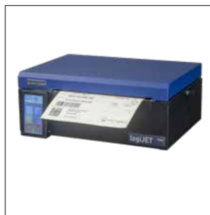
Imprimante thermique mobile - p.e. logiJET TM8