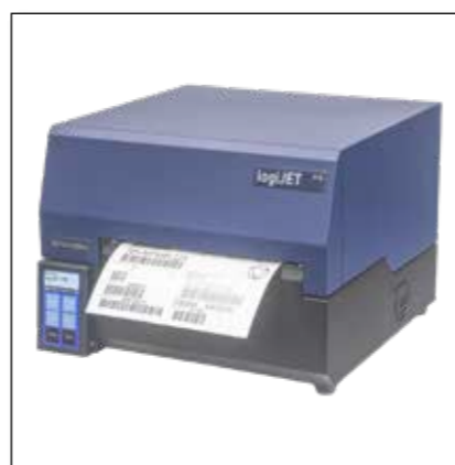
Imprimantes thermiques- p.e. logiJET TT8