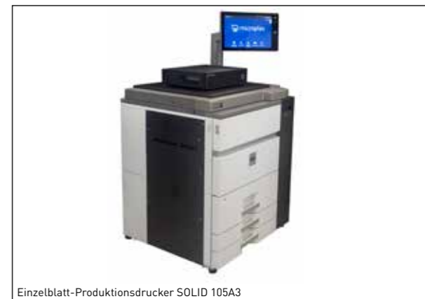
Einzelblatt-Produktionsdrucker SOLID 105A3

Beispiele für Microplex-Produkte für den Ersatz in SAP-Druckumgebungen.