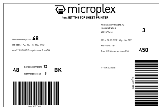
La cubierta superior típica para pilas de periódicos en formato A4.