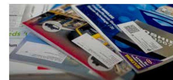
Revistas con la etiqueta Cheshire