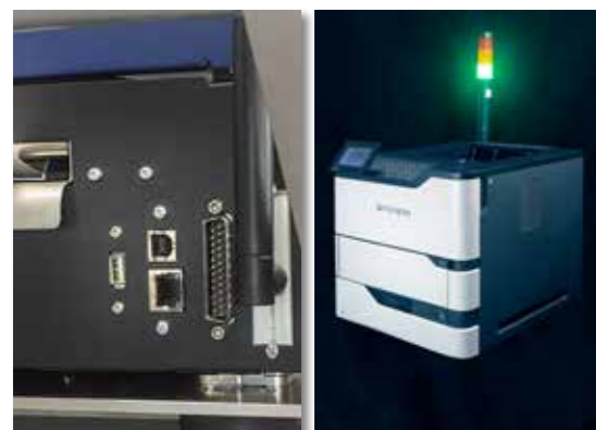
Conectores logiJET TM8