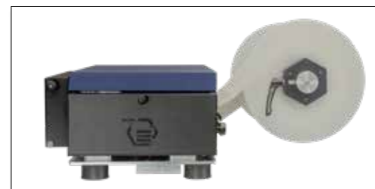
logiJET TM8 - Alimentación de papel desde un rollo

Los sistemas de impresión térmica de Microplex pueden procesar e imprimir rollos de papel, así como papel plegado en zigzag desde la pila (cartón). Cargar el material de impresión es rápido y fácil.