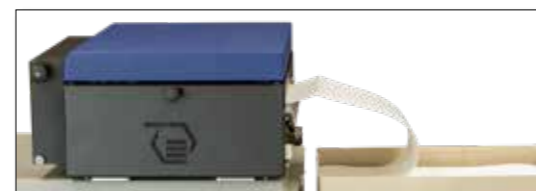
logiJET TM8 - Alimentación de papel plegado en zigzag

La alimentación de papel a través de una pila o un rollo garantiza un transporte de papel sin problemas hacia la impresora. Las cubiertas superiores se separan después de la impresión mediante un cortador opcional. A partir de aquí, las hojas individuales resultantes pueden ser recogidas por la planta de procesamiento y transportadas. Puedes utilizar la alimentación externa de papel para adaptar de manera flexible el suministro de papel a tus necesidades, de modo que, por ejemplo, puedas producir un cambio de turno sin tener que cambiar de papel. Aquí se muestra el ejemplo del logiJET TM8 .