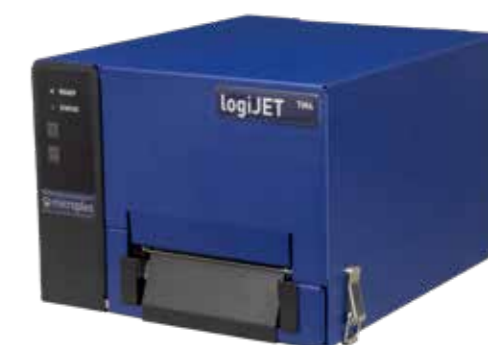
Impresora térmica móvil logiJET TM4