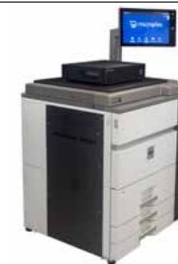
Impresora de producción de hojas sueltas SOLID 105A3-2

Ejemplos de productos Microplex para sustitución en entornos de impresión SAP.