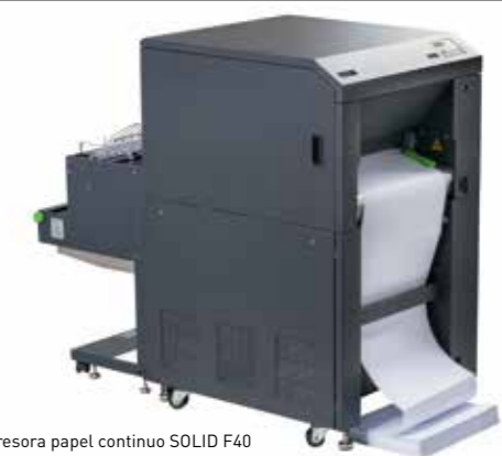
Impresora papel continuo SOLID F40