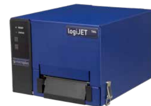
Impresora térmica móvil logiJET TM4