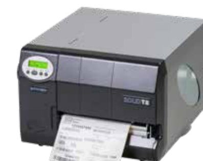
Impresora térmica de alta velocidad SOLID T8