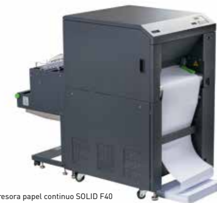
Impresora papel continuo SOLID F40