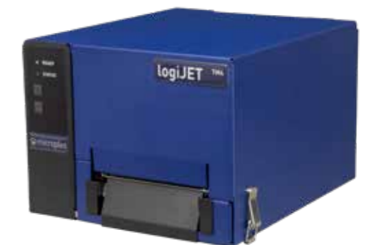
Imprimante thermique mobile logiJET TM4