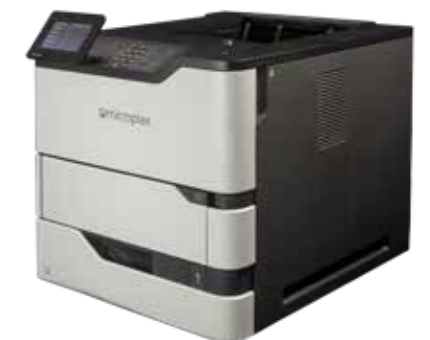
Imprimantes laser feuille-a-feuille SOLID 52A4