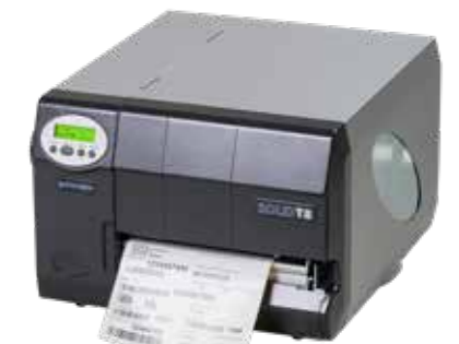
Imprimante thermique haute vitesse SOLID T8