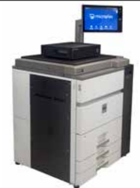
Imprimante de production à feuilles à feuilles SOLID 105A3

Exemples de produits Microplex pour remplacement dans les environnements d'impression SAP