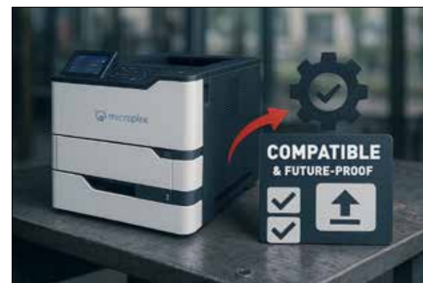
Produits Microplex destinés à être utilisés dans des environnements d'impression IPDS.