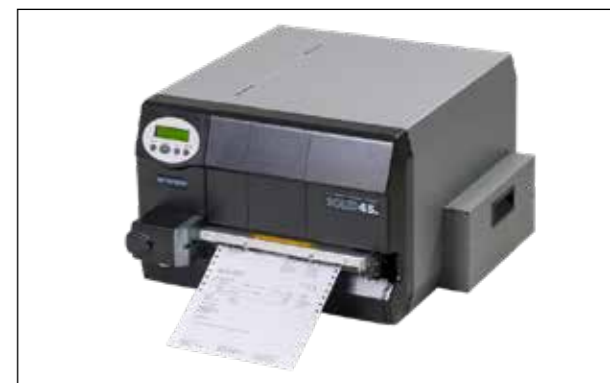
SOLID 45ET Imprimante thermique Tracteur