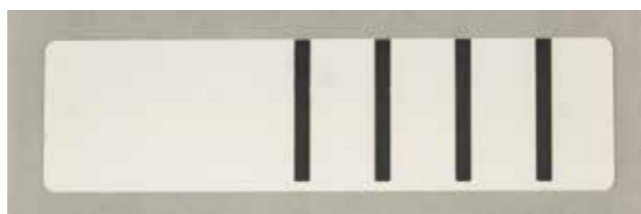
Une étiquette RFID illisible est annulée pour des raisons de sécurité d'application.